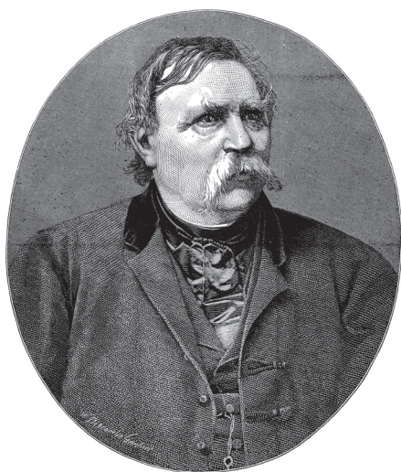
Deák Ferenc (1803–1876) portréja az Illustrated London News újság 1876. február 19-i számában megjelent gyászjelentője mellett

Deák főleg végzettsége terén volt aktív politikai pályafutása idején, így az igazságügyet érintő kérdések foglalkoztatták a legjobban. E téren komoly kihívást jelentett számára Wesselényi