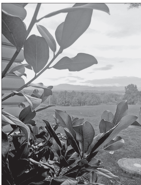
Kilátás a Rozsályra a Teleki-kastélyból, szeptemberben (Még nyílnak a völgyben a kerti virágok...)

Gutin (937 m), Kakastaréj (1447 m), Rozsály (1307 m) ormait.