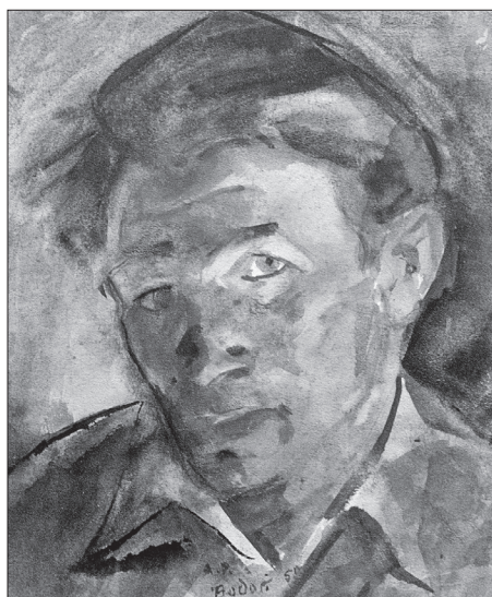
Önarckép (1950, akvarell)

Bár rajzkészsége és esztétikai érzéke már egészen fiatal korban megmutatkozott, eredetileg épület- és műbútorasztalosságot tanult.