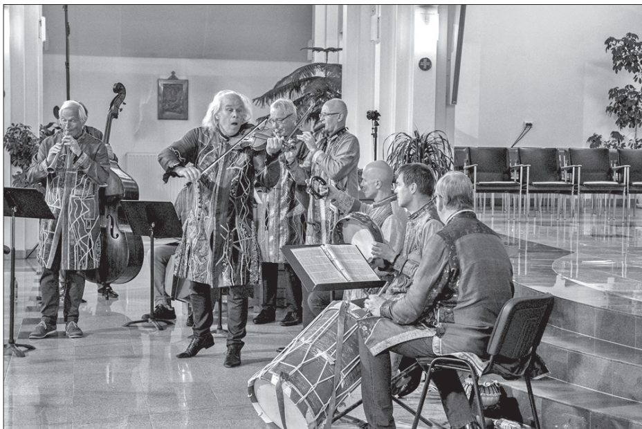
A Hortus Musicus koncertje a Csíkszeredai Régizene Fesztivál 2022-es kiadásán.

Artúr király sosincs jelen személyesen. Mintha csak a távolból ösztönözne minket: üljetek le, beszélgetsetek. Engedjétek ki, hogy be tudjatok engedni. A zene lépcsőháza, fényudvara legyen a szívetek. Ne sajnáljátok az időt, mert közös.