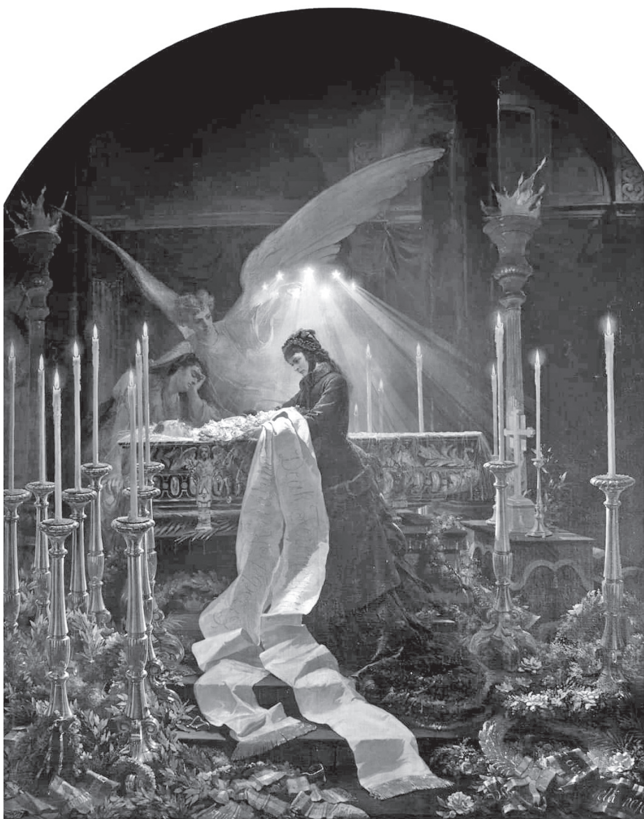
Erzsébet királyné Deák Ferenc ravatalánál. Zichy Mihály festménye