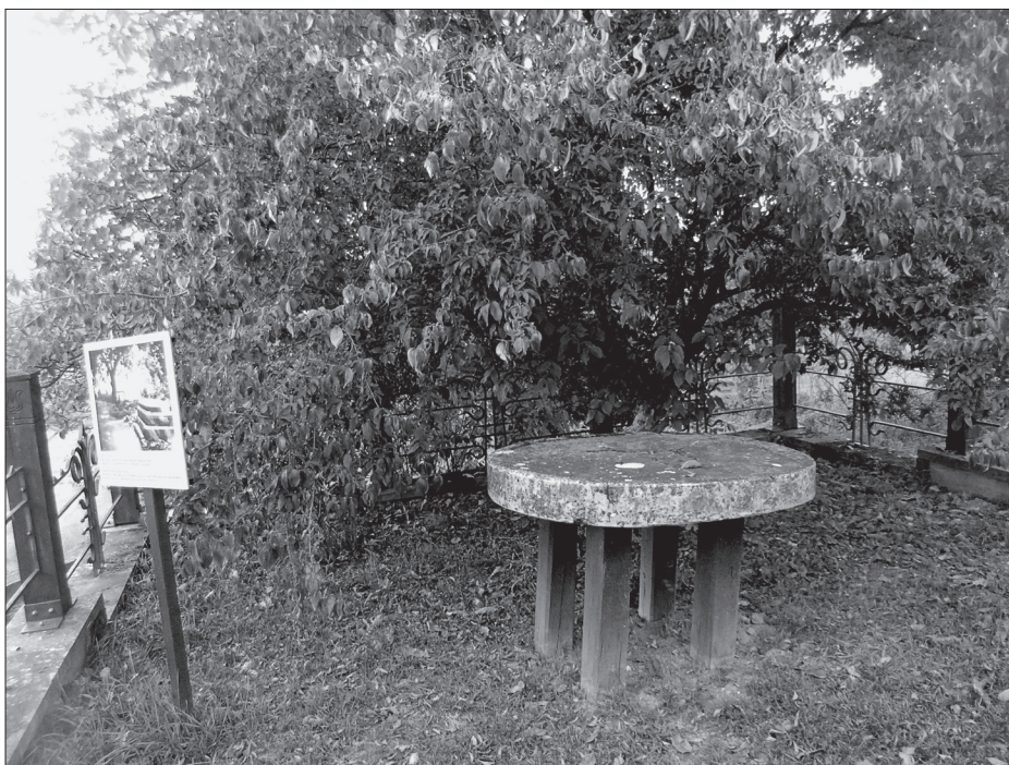
A nevezetes kőasztal Koltón, talán itt született a Szeptember végén című Petőfi-vers