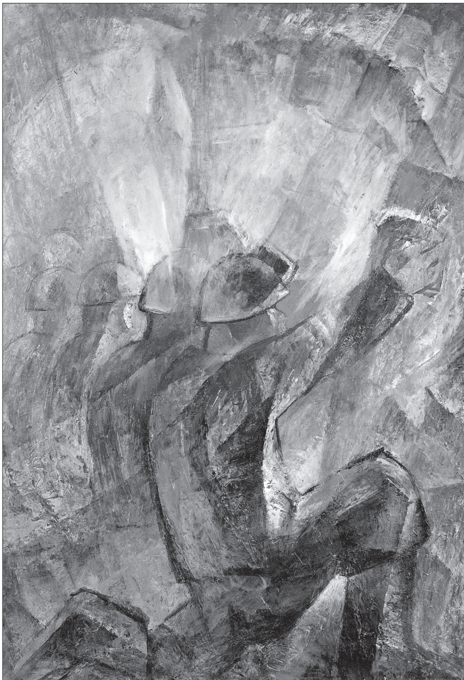
Elővágatban (1985, olaj)

ismét hazatért Barótra, ahol elszigetelten ugyan, de teljes életét a képzőművészetnek szentelte 2006-ban bekövetkezett haláláig.