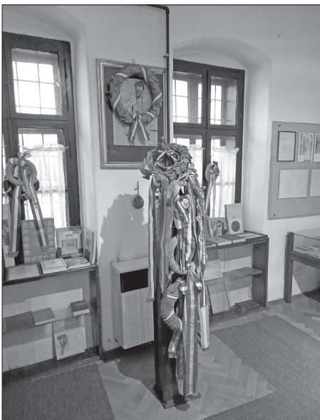
A Misztótfalusi Kis Miklós-emlékszoba részlete