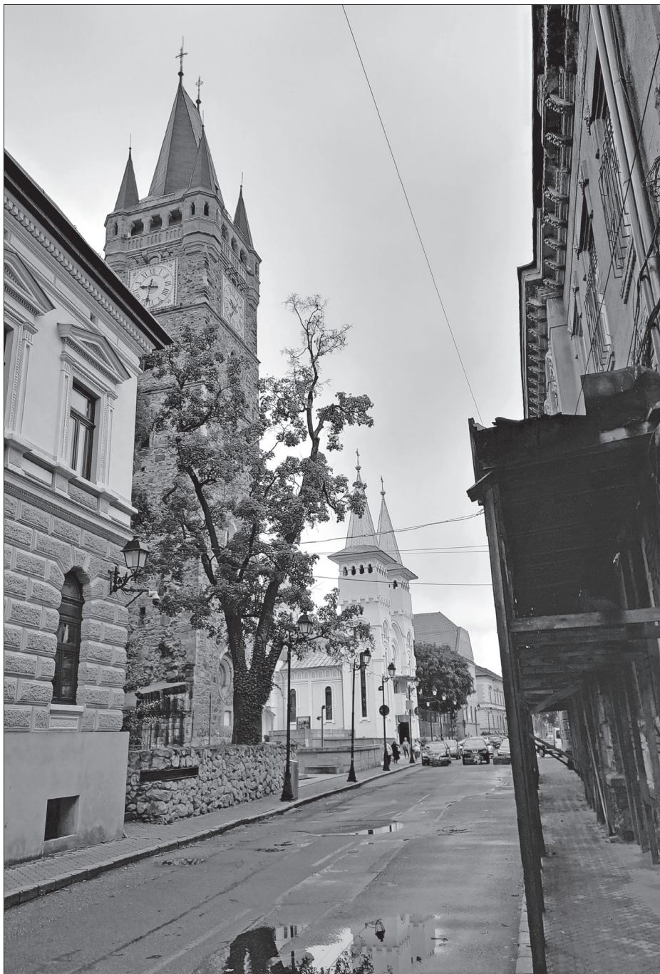
Nagybányai utcarészlet, középen az István-torony

egyház ügyeibe beavatkozzon, ebben csak a Szentszék lenne illetékes. Gyulafehérváron hosszú évekig házi őrizetben volt, nem hagyhatta el a püspökség területét.