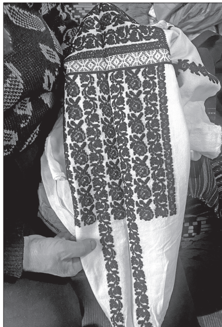
Női ingujj hímzése Bogdánfalváról.