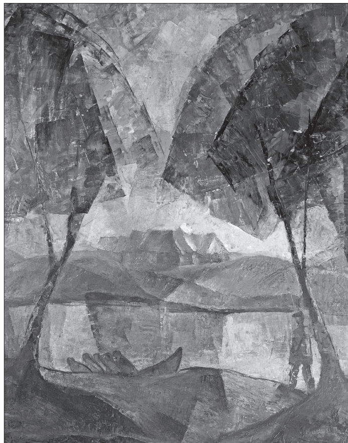
Halászos (1970, olaj)

A további termekben a művésznék a női test szépsége, a mozgás, a tánc dinamikája, illetve a spektrumaira bontott fény vibráló ritmusa iránti érdeklődése bontakozik ki, amely az életmű egészen egyedi szeptétét nyújtja, akár csak a Tánc , Ritmus vagy a Napkelte című képek esetében.