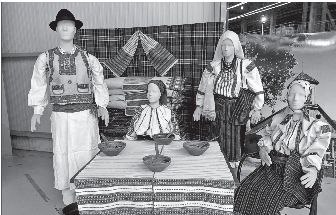
Lujzikalagori férfiviselet, klézsei gyermekviselet, lészpedi női viselet.

népviselő felismerése, egyéb népviselethez való megkülönböztetése valójában egyfajta deskriptív tudás, amely semmit sem mond el például arról, hogy hogyan kell felöltöni az az öltözetet. Nem is gondolnák, mennyi finom, de fontos követelmény van a felöltésében, és hogy milyen érzés felvenni ezt a viseletet.