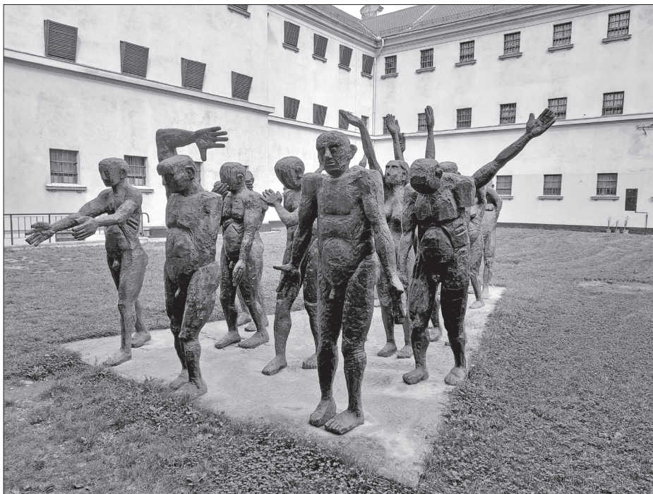
A börtönmúzeum belső udvarán az áldozatok emlékműve, Aurel Vlad alkotása