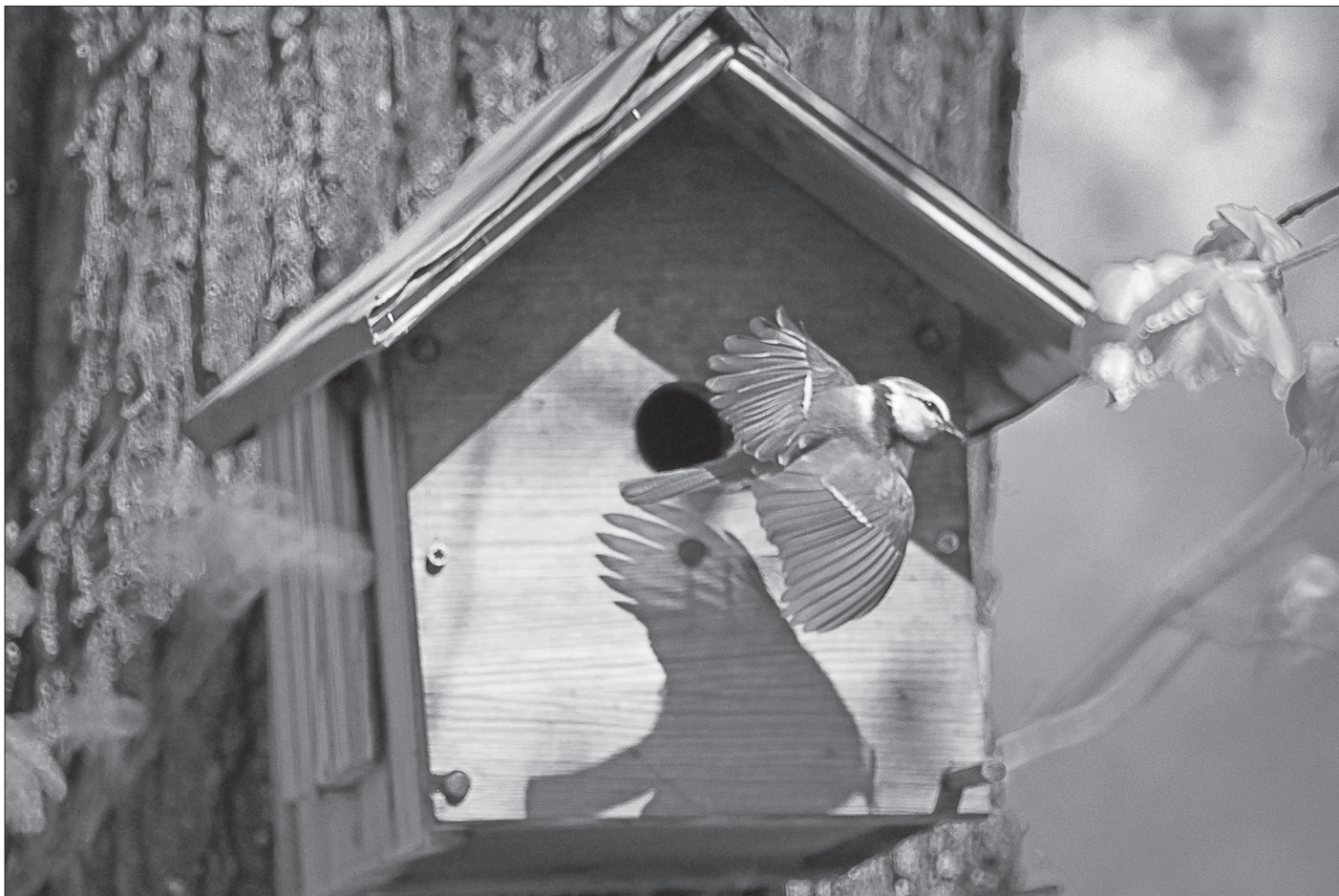
Kékcinege az odunál

zsibbadás forrása lehet. Nem szabad felednünk, hogy komoly figyelemmel kell lennünk alanyainkra, hiszen felelősek vagyunk értük. Vannak fajok, amelyek fészknél csak különleges engedéllyel szabad fényképezni (pl. parlagi sas vagy fekete gólya stb.). Vannak fajok, amelyek revírjében (fészkelési területén) nászidőszak idején vagy kotláskor hanghívással csalogatni nem szabad, mert a madár nem tud „versengeni” az elektronikus eszközökkel, és a revír esetleges elhagyása miatt tiltott az ilyen módszer. A madárfotózás etikai vonatkozásainak ismerete elengedhetetlen. Bárki fényképezheti a természetet, az állam azonban a természet védelmének érdekében alaposan rendszabályozza a fotózás feltételeit. Ajánlott alaposan tanulmányozni a www.greenfoto.hu weboldalt, vagy a Milvus egyesület szabályzásait. Tudnunk kell, hogy a védelem nemcsak bizonyos fajokra, hanem élőhelyekre is vonatkozik. A fokozottan védett helyeken még a fű is védett! A madárfotózáskor semmi szín alatt nem lehet ösztönző tényező a hírnév vagy a pályázati díjak megszerzése. A nemzetközi fotóversenyekről eleve kizárják azokat a