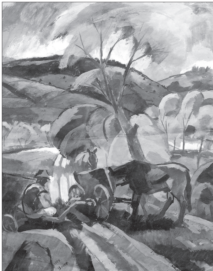
Pihenő (1953, tempera)