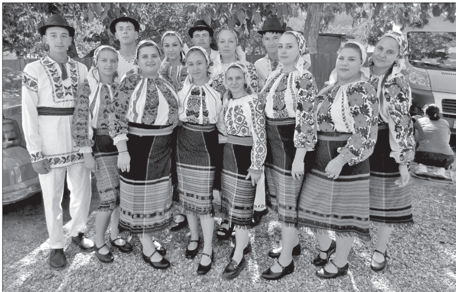
Fiatalok dumbraveni viseletben

itt egyszerű, elől zárt szoknyát találunk, ennek neve rokoja vagy rokola.