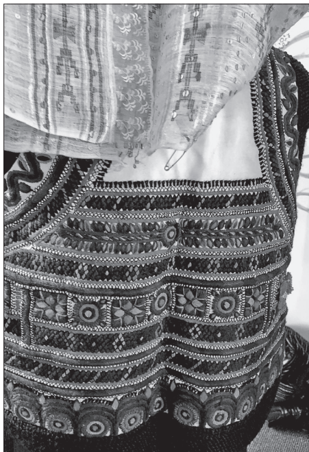
Női bunda Klézséről.