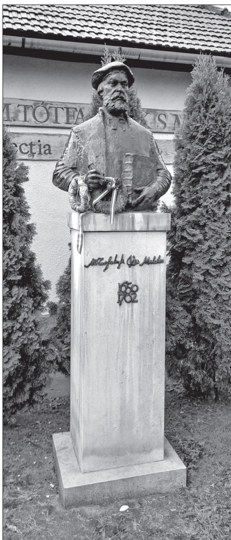
Misztótfalusi Kis Miklós szobra

„Méltóságos gróf Teleki Sándornak barátilag ajánlom...”; majd ezt írja: „Hát Pócsi Laci ad-e még mindig kardvágásokat nyírettyűjével? Nagyon vágyom rá, hogy huszadik és utolsó rapszódiámat Önnél, Koltón írjam meg, s főleg, hogy ismételhessen csendesesen az én régi, nagyon odaadó barátságomat.” Liszt a cigányok zenéjéről írt könyvében Pócsi Laciról is megemlékezik. Teleki mindvégig őrizte Liszt három zeneművének kottáját ( Magyar rohaminduló , Második magyar induló és a Lovasdal ), amelyeket ajándékba kapott a zeneszerzőtől (Liszt 1886-ban, Teleki 1892-ben halt meg).