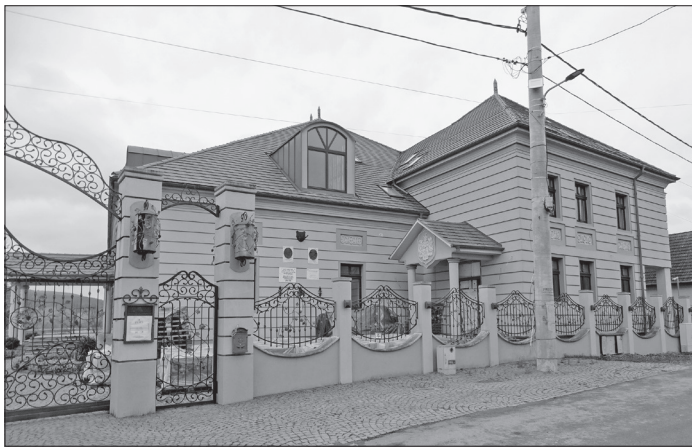
A kelemenelki Simén-kúria

EZEN A TELKEN ÁLOTT A „SZARVAS” FOGADÓ, AHOL PETŐFI SÁNDOR 1849. JÚLIUS 24-ÉN MEGSZÁLLT