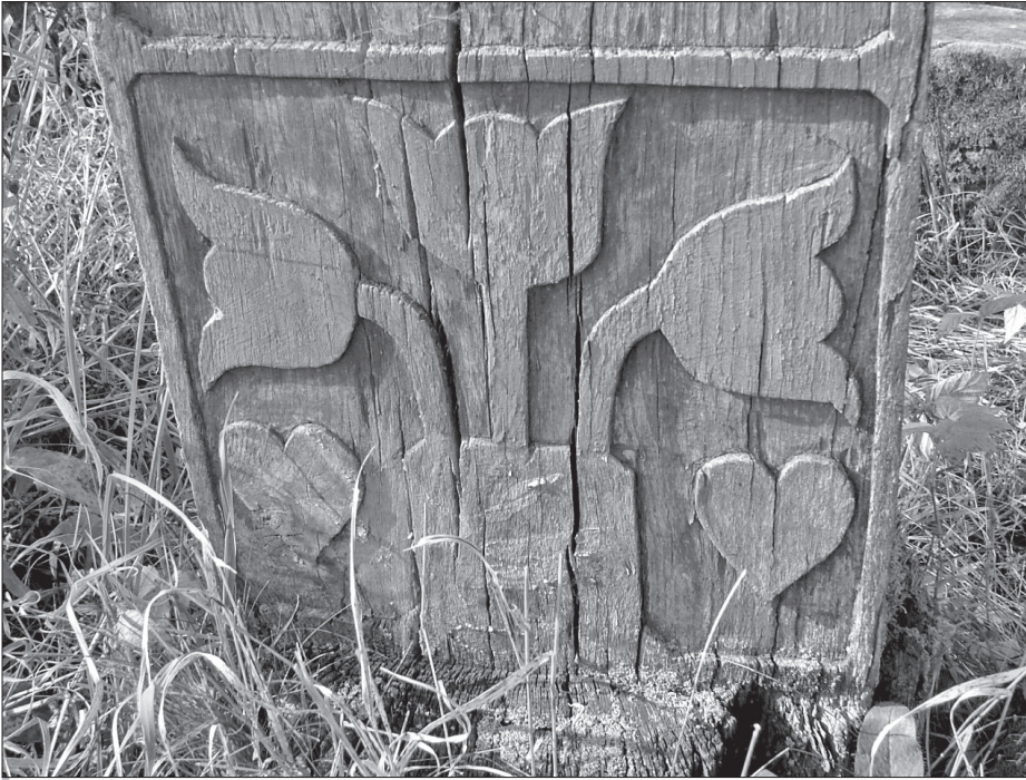
Faragott, színes tulipánmotívum. Kép: Pálfalvi Pál, Doboly, 2007. április 28.