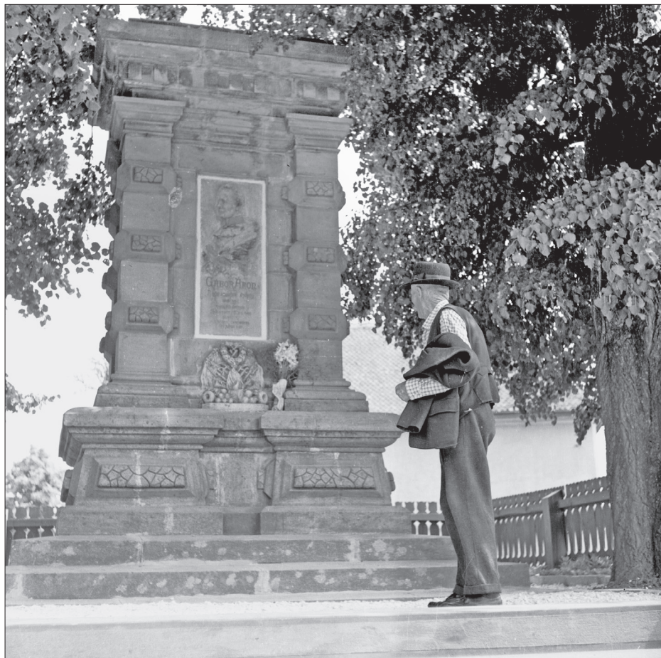
„Gábor Áron megérdemli Háromszéktől, hogy sírja fölé olyan monumentumot állíttasson, mely előtt az idegen bámulva, a hazafi imádkozva álljon meg.”

Bortnyik György felvétele az 1970-es évek elejéről. Kép: a Székely Nemzeti Múzeum fotótékája