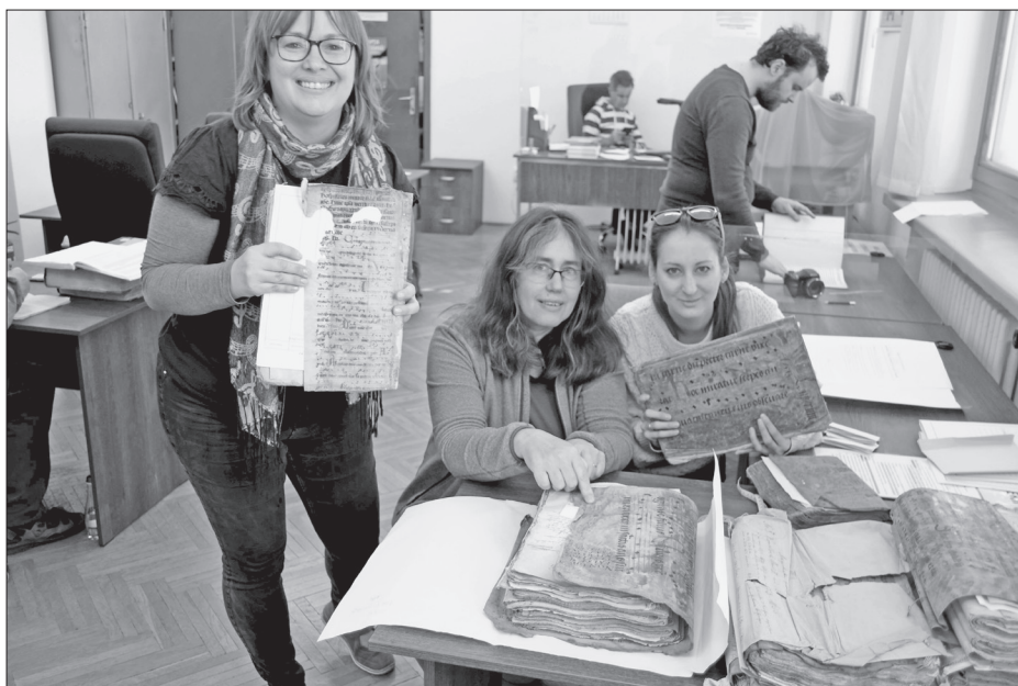
A csapat és a töredékek a Kolozsvári Állami Levéltárban

A Kolozsváron, Gyergyószentmiklóson és Csíkszeredában folytatott kutatásnak célja volt: minél több középkori kottás kódextöredék föltárása.