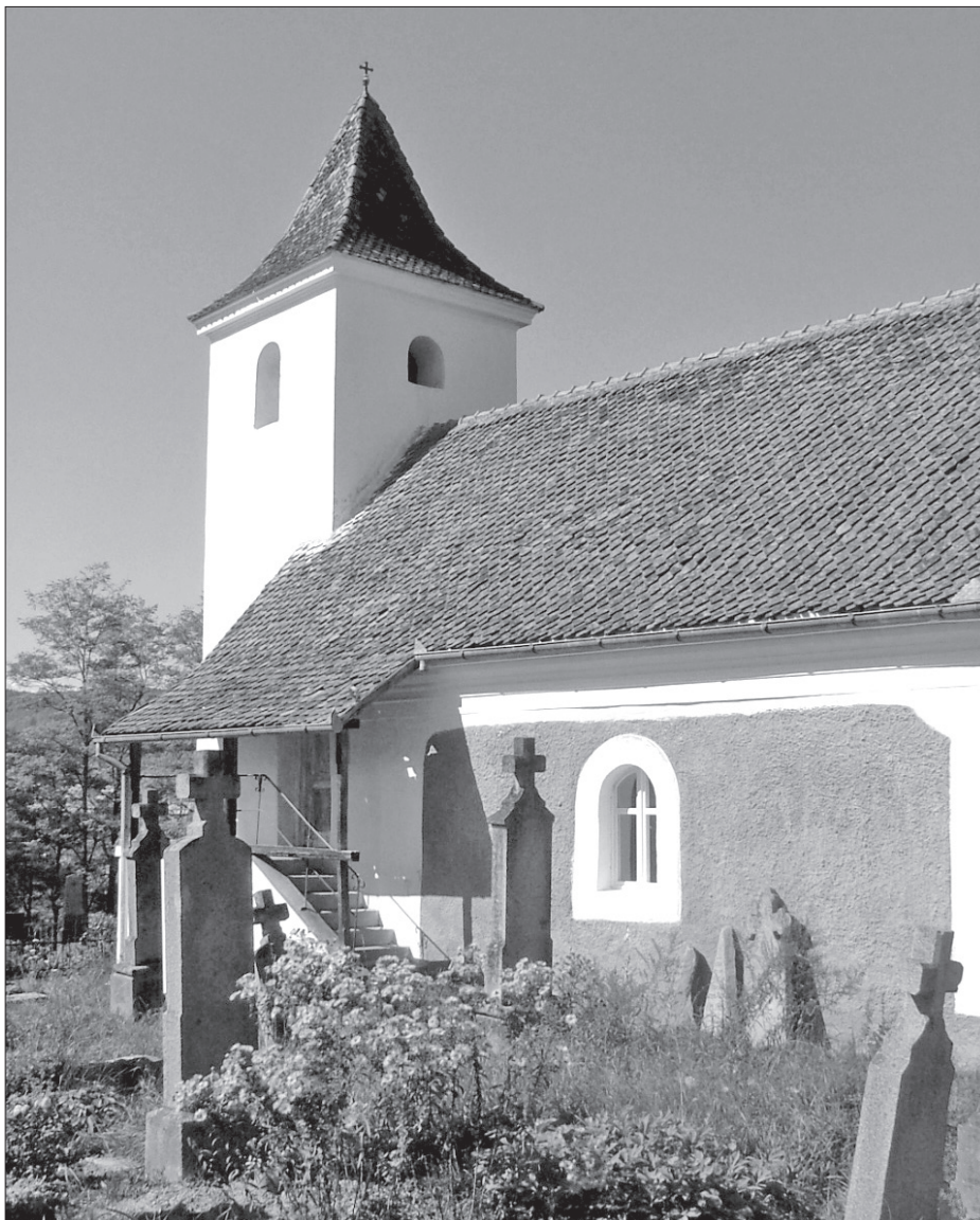
A kászonújfalvi temetőkápolna, oldalához támasztva a feliratos, régi homokkő sírjelek, előtérben a mirigyes őszirózsa, gerebcsin. Kép: Pálfalvi Pál, 2007. szeptember 27.

érdekes, ritka, értékes színfoltjai ezek a temetőnek. 3