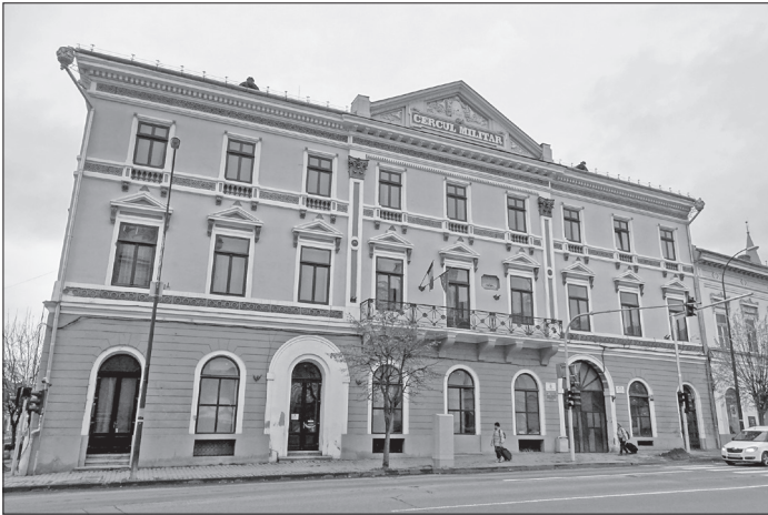
A marosvásárhelyi Görög-ház, 1849 júliusában innen indult Petőfi a segesvári csatába

pesti orvosprofesszor megállapította ugyan, hogy a csontváz egy öregemberé volt – a honvédtiszt lehetett idős ember is –, ám a keresztúriak féltve őrzik a maguk „Petőfijét”.