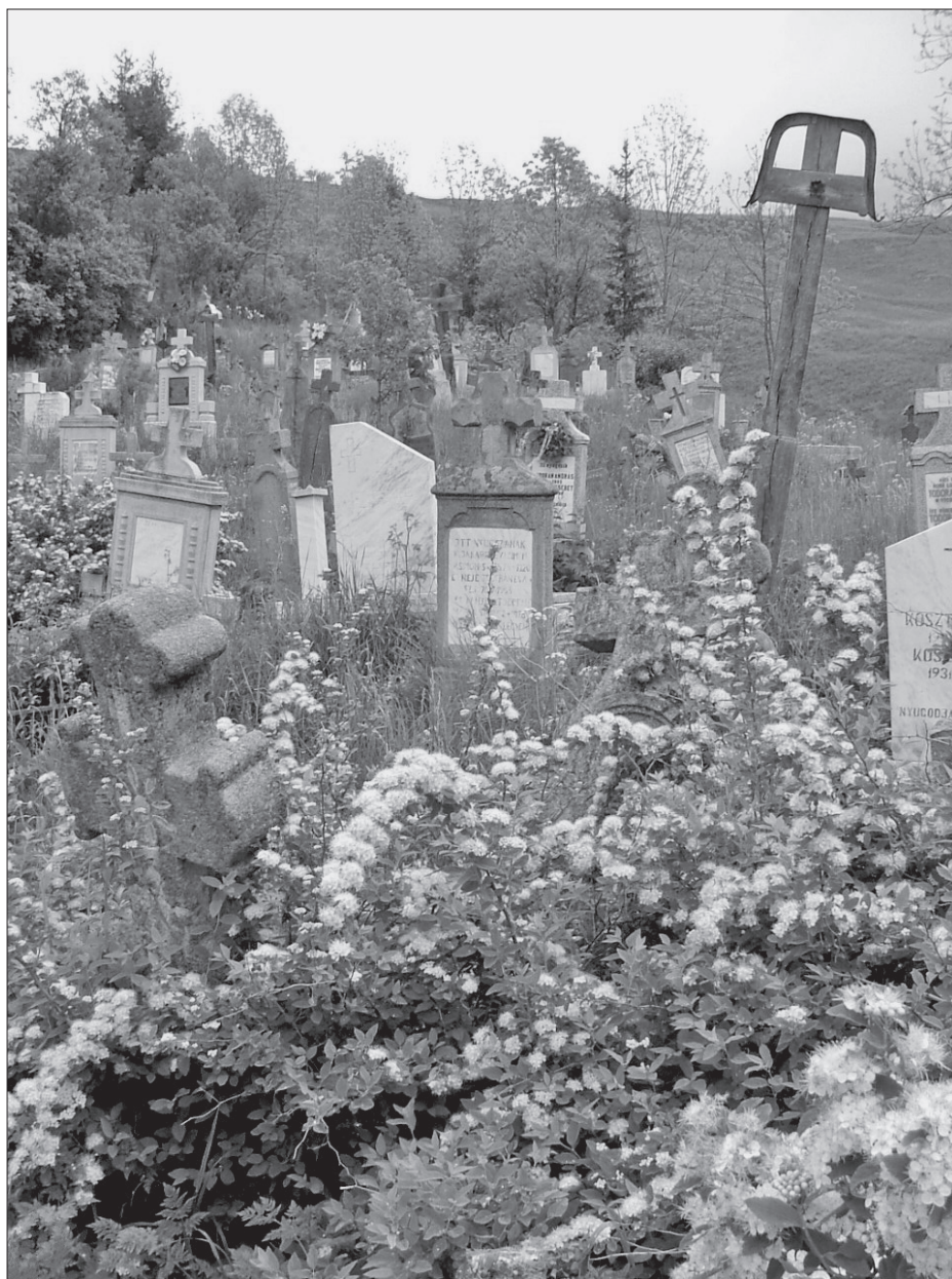
Dobolyi temetői kép, előtérben a virágzó Mária-coszorúval ( Spiraea chamaedryfolia ). Kép: Pálfalvi Pál, 2007. április 28.

illetve fehér bogláros krizantém élénkítette a sírhanok egyikét.