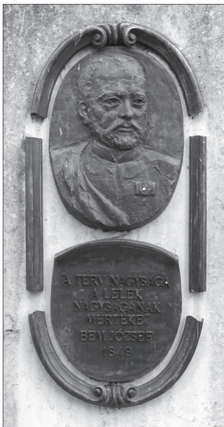
Bem apó emlékműve Fehéregyházán