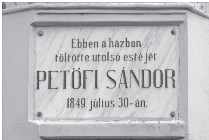
Emléktábla a Gyárfás-kúria falán, Székelykeresztúron

De menjünk sorjában, és lássuk, mit tudunk költőnk csatabeli sorsáról. Csak egy-egy villanásra „látjuk” Petőfit ezekben a nehéz percekben. Illyés Gyula azt írja, „...mint a megszakadt filmszalag ugráló, ferde képei a hökkentő fehér üresség előtt.” Igen, valószínűleg pontos és hiteles adatunk van róla – egy-egy másodperc erejéig. S „a többi, néma csend”. Petőfit és Gyalokayt akkor hagytuk el, amikor kocsijukon megérkeztek Fehéregyházára, reggel 7-8 óra körül. Éppen az úgynevezett „filagóriánál”, egy, a Haller-kastélyhoz tartozó különös, falusi környezetbe nem illő, emeletes épületnél jártak. Meghallván az első ágyúszókat „mint a nemes harci mén, mely a rohamot jelző kürt szavára ideges lázzal röpi előre, Petőfi is a csata első jelét meghallva, üléséből izgatottan felpattant, a kocsiból búcsúzás nélkül leugrott, és sebesen előreszaladt” – emlékezett vissza Gyalokay Lajos százados feljegyzéseiben.