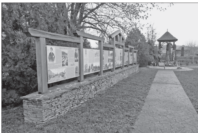
A Gyárfás-kertben felállított térinstalláció