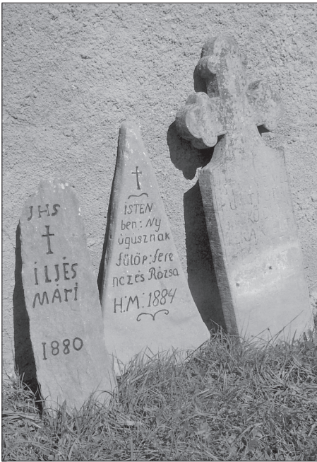
A kászonújfalvi temetőkápolna oldalához támasztott feliratos, régi homokkő sírjelek. Kép: Pálfalvi Pál, 2007. szeptember 22.

mintegy 40 napot töltöttem terepen. Az öt kászoni temetőt autóbusszal, autóstoppal, valamint gyalogosan kerestem fel. Szállásomat tanítványaim, tanító- és tanárkollégáim biztosították. A kászoni baptista temetőt nem volt alkalmam tanulmányozni.