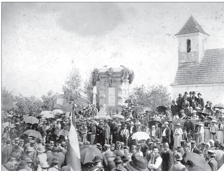
Gábor Áron síremlékének avatása 1892. július 31-én.

„... bátyám, Gábor Áron lelki ügyeit annak családja – már rég rendbehozta...”