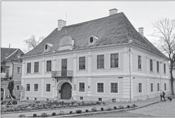
A Teleki-ház Marosvásárhelyen