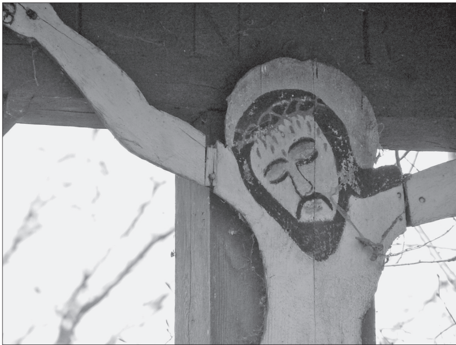
„Glóriás Jézus” a kereszten. Kép: Pálfalvi Pál, Kászonaltíz, 2007. április 28.

Tekintettel a kutatási terület kiterjedt voltára és a temetők nagy számára, a kászoni sírkertek részletező vizsgálata meglehetősen későn, főként 2002 és 2009 között zajlott, de még napjainkban is folyik. A temetőkben 5 (Doboly – ortodox temető), 9–11 (Kászonimpér, Kászonjakabfalva, Kászonújfalva – katolikus temetők), illetve 15 (Kászonaltíz – katolikus temető) alkalommal dolgoztam,