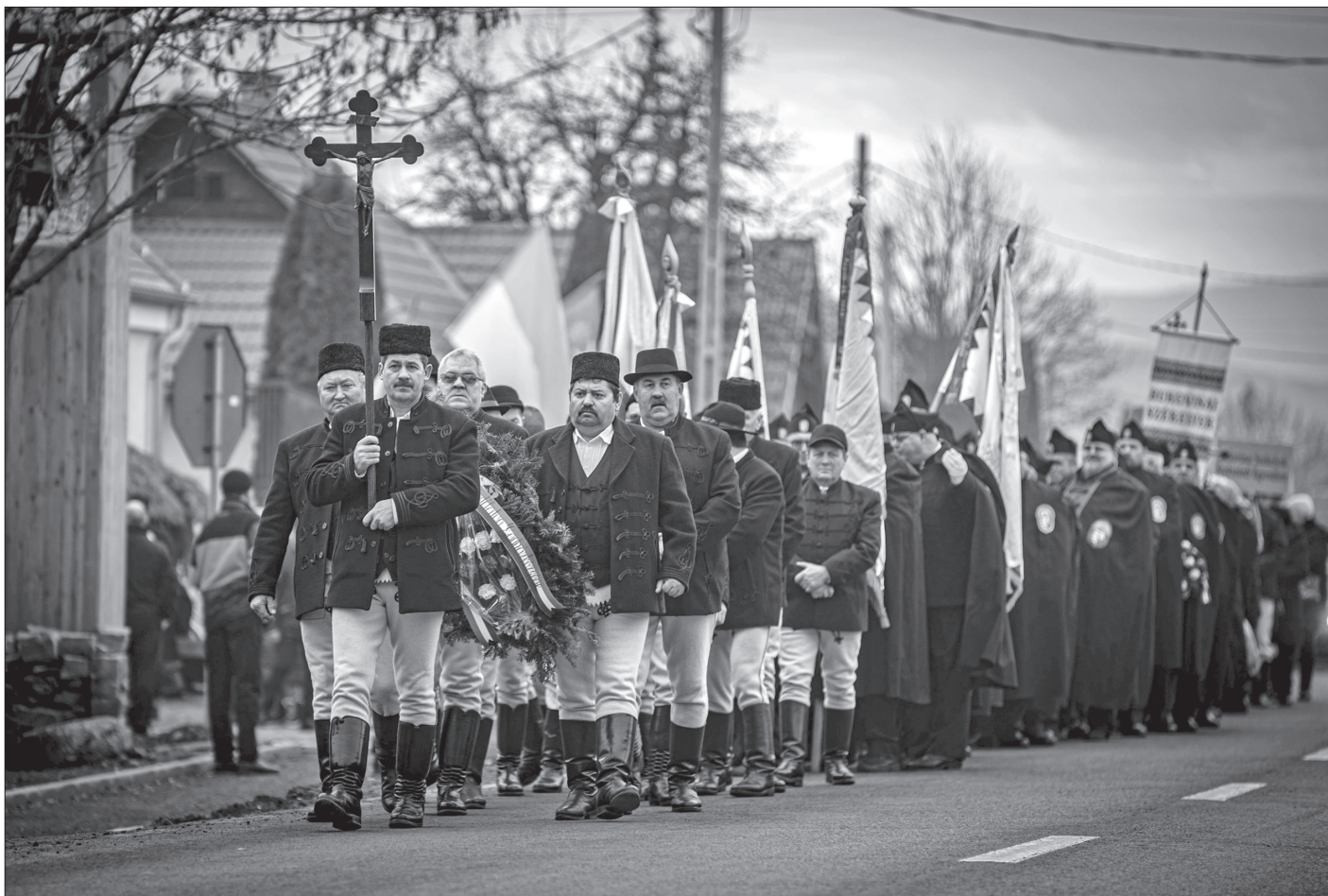
Siculicidium 2024. A madéfalvi keresztalja a Szent Anna-kapornába tartandó misére vezeti az emlékezőket