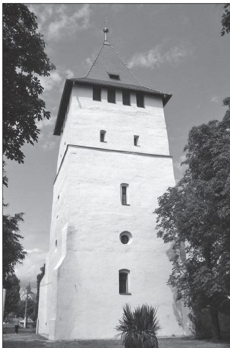
A Csonkatorony Nagyszalontán.