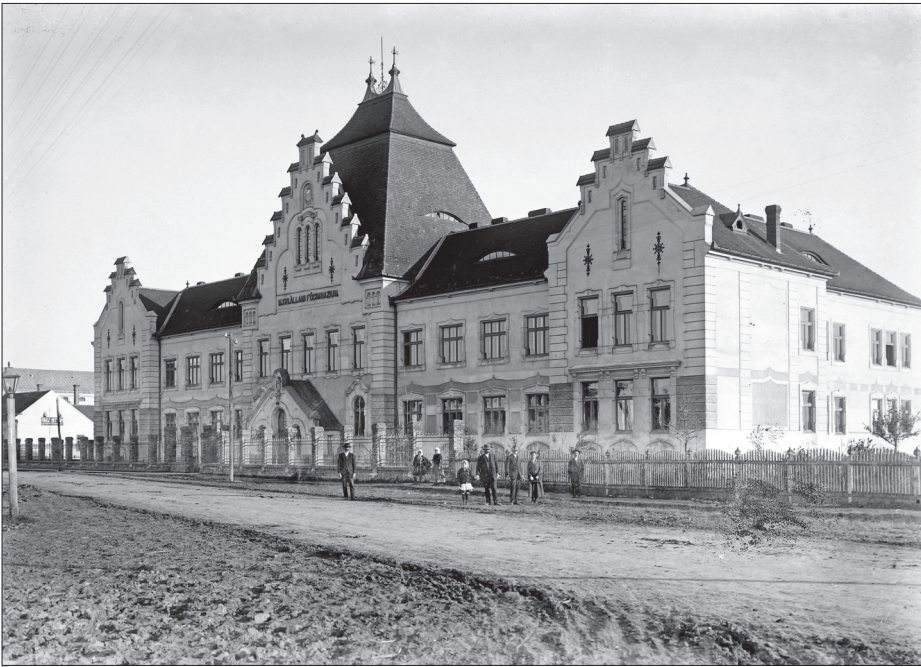
A Magyar Királyi Főgimnázium (ma Arany János Főgimnázium) Nagyszalontán, 1907-ben.

hányadát a románság tette ki. Váradon a románság politikai szerepet nem játszott, ám egyházaik erősek voltak, több templomuk is volt a városban. Iosif Vulcan megindította a Familia című román újságot. A Bihar megyei anyja után román gyökerekkel rendelkező Gozsdu Manó iskolát alapított a városban, és mivel nem voltak örökösei, vagyonát a román görögkatolikus egyházra hagyta, hogy a vagyonából tanulhassanak az erdélyi görögkatolikus fiatalok. Vagyonának tőkéjét a szebeni román püspökség kezelte, ebből aztán Trianon után bonyodalmak lettek a két állam között. (L. a Gozsdu-udvar esetét Budapestén.)