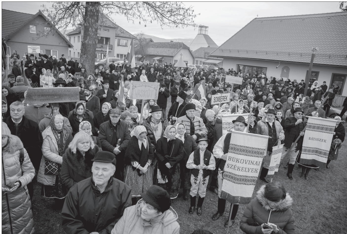
Siculicidium 2024. Testvértelepülések küldöttségei, elszármazottak az emlékmű körül

meghallgatásán, mire azok vízkereszt ünnepére hivatkozva másnapra kértek halasztást.