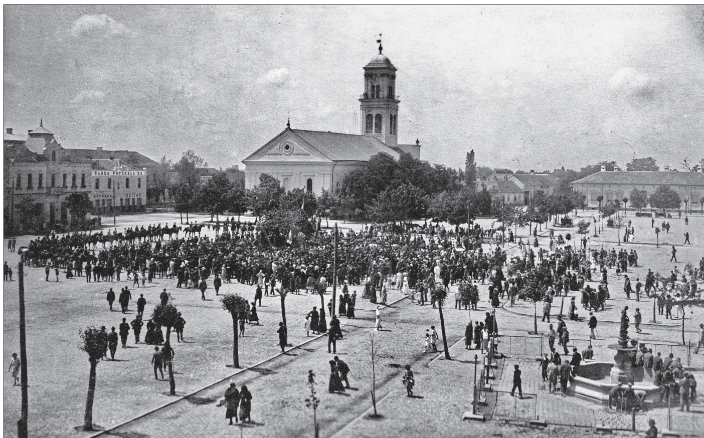
Nagyszalonta főtere 1917-ben, szemben a református templom.

ben. 1794-ben a jakobinusok perében Martinovics mellett várfogságra ítélték a Váradon élő Szentjóni Szabó Lászlót, aki Kazinczy Ferenc baráti köréhez tartozott. Szabadkőműves páholyok is működtek a városban, ezzel már Európa is bejelentkezett Váradra. (A 18. században Angliából indult ki, egész Európában elterjedt, a polgári liberalizmus elveit hirdette. A 19. század második felében élte virágkorát, de már elhatárolódott a polgári pártoktól, az észszerű racionalitáson alapuló gondolkodást terjesztette, a szabadság, egyenlőség, testvériség eszméit fogadta el.) A 18. század második felében kaptak engedélyt az egri irgalmas rendiek, hogy Váradon ispotályt építsenek. Előbb a rendházuk, majd a város első kórháza a század végére készült el, Forgách Pál és Patachich Ádám támogatásával. Az építkezés folytatódott, és a kórházzal szemben felépült a Barátok temploma is, a ferencesek építették 1738-ban, Szent Jánosnak szentelve. Ugyanekkor gyógyszertárral is kiegészült a kórház, a költségeket Gyöngyösi György kanonok biztosította. II. József császár és magyar király 1786-ban eltörölte a szerzetesrendeket a birodalomban, a ferences rend ekkor elhagyta a várost. A templom tornyát csak 1891-ben emelték, ekkor a templom