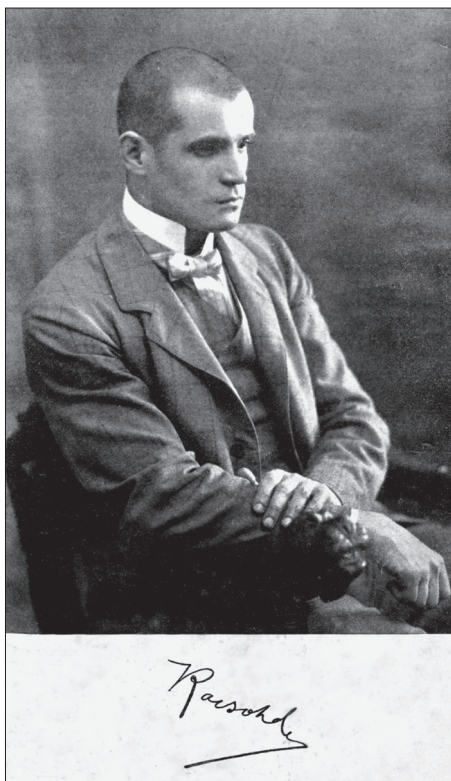
Kacsóh Pongrác fényképe és aláírása az első, 1904-es kiadás albumában

1887/1888. Kacsóh Pongrác az V. o. tanulója, 14 a tanév végén könyvjutalmat és 5 Ft. összeget nyert a Halmágyi István-alapból. 15 De történt ennél érdekesebb is. Már az előző tanév értesítőjében megjelentek az 1887/88-as tanévre kiírt pályakérdések. Közöttük mennyiségtanra: „A több ismeretlenes első