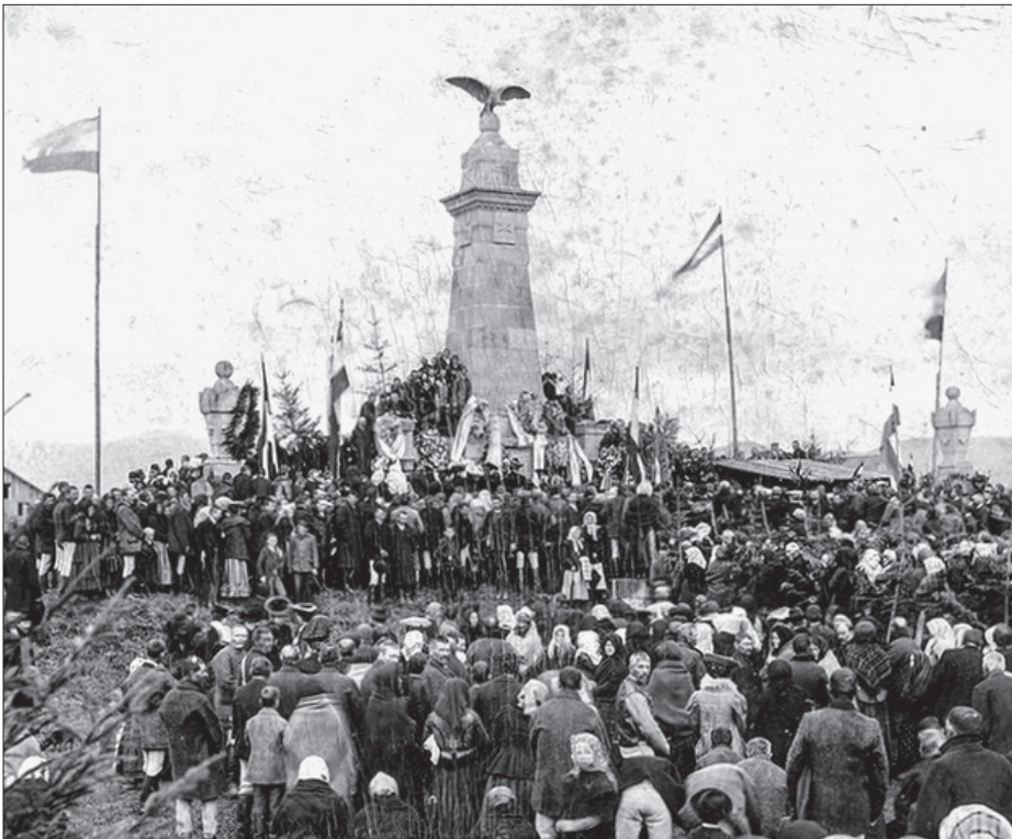
Az emlékműavatás korabeli felvételen. Az Emelt fővel című kiállításban szereplő reprint felvétel

A Siculicidium jelképértéke nemcsak napjainkban meghatározó – ahogyan a 250 éves évfordulóra szervezett nagymérvű megemlékezés, az évente megrendezésre kerülő többnapos eseménysorozat mutatja –, hanem már a 19. században is nemzeti értékű fontosságot tulajdonítottak e tragikus eseménynek. A centenáriumi évfordulóra készülve az 1850-es években a csíki közösség értelmiségi tagjait élénken foglalkoztatta, hogyan lehetne a határsaihoz mérten kellő figyelemben részesíteni a székely nép történetének e tragikus momentumát.