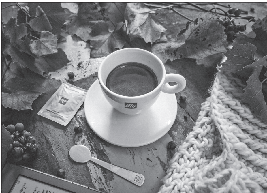
Kávészséze a jól ismert Illy-logóval

A nápolyiak szerint az észak-olaszok a déliek kultúráját akarják a sajátjukként eladni. A campaniai régióban élők szerint az történik, mint 2017-ben: ekkor a pizzát és a pizzakészítés mesterségét vették fel a világörökségi listára, azonban először nem Nápolyt tüntették fel az olasz eredetű étel őshazájának. Akkor végül a déliek kiharcolták maguknak, hogy a „nápolyi” megnevezés a pizza mellé kerülhessen, kérdés, most sikerrel járnak-e. Olaszország egyébként a pizzán túl ötvenöt, felbecsülhetetlennek tartott természeti, kulturális, illetve építészeti örökséggel büszkélkedhet. A listán megtalálhatók a Lipari-szigetek, a Velencei-lagúna, az Amalfi-part, Pompeii és a Herculaneum régészeti lelőhelyei, a Dolomitok, továbbá Nápoly, Siena, Róma és Firenze történelmi központjai is.