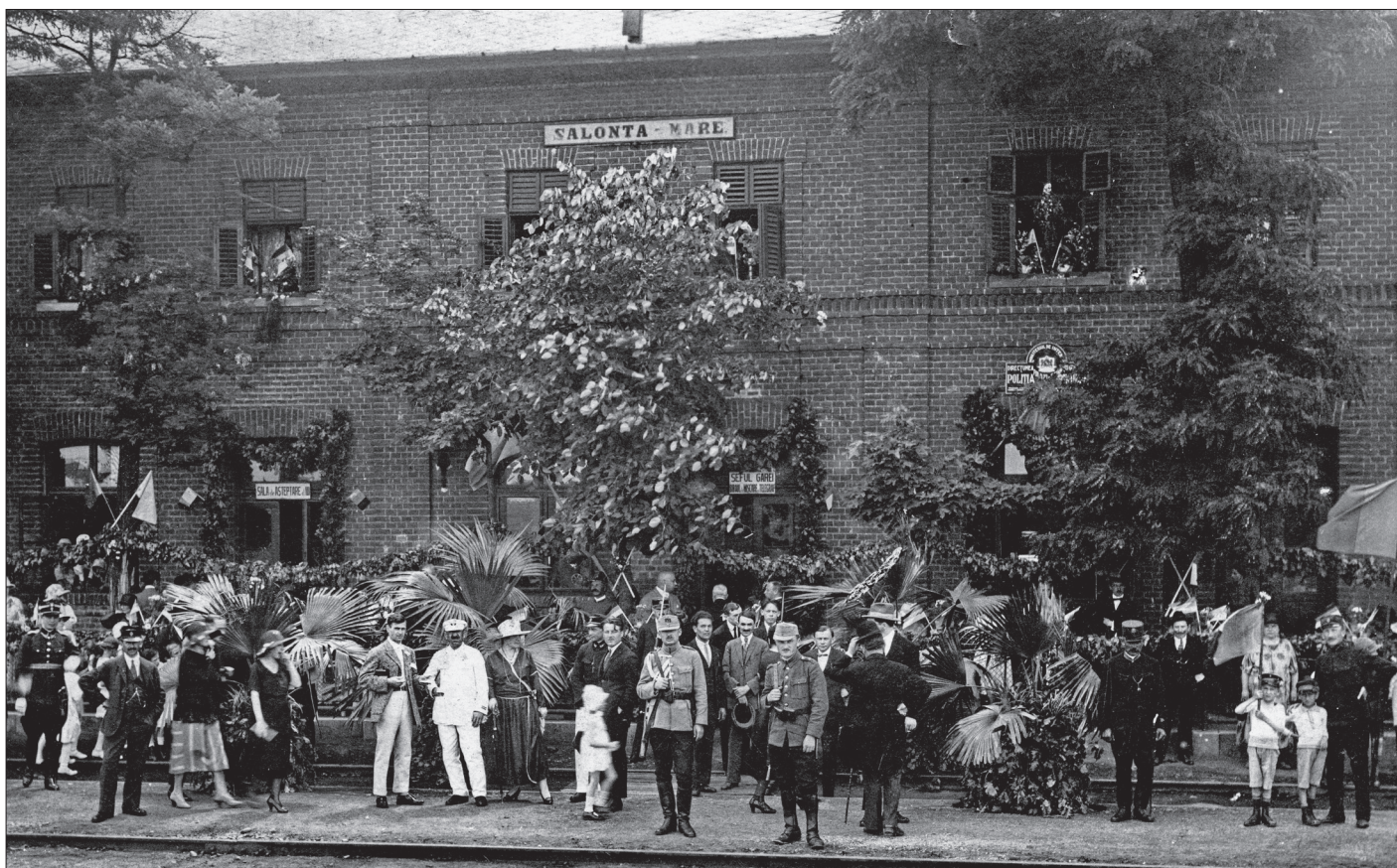
A nagyszalontai vasútállomás egy 1921-es felvételen.

papja megtagadta. Beőjthy a forradalom idején az erdélyi szabadságharc egyik szervezője volt, Világos után menekülnie kellett, mert őt is halálra ítélték. Tragikus sorsú elvbarátját, a szintén váradai Szacsvay Imrét kivégezték, akinek „csak egy tollvonás volt a bűne”, lévén jegyző Debrecenben, amikor a kormány megszavazta a Habsburgoktól való elszakadást. A szabadságharc idején Váradon találkozott Bem és Kossuth, ekkor Szacsvay volt az ünnepi szónok, mindez elég volt később egy halálos ítélethez. A század végén a hálás utókor, a rá még emlékező váradiak szobrot emeltek a tiszteletére. 1919-ben a helyi kommunisták talpig vörösre mázolták a szobrot, ugyanakkor a tett ellen tiltakozó nemzeti érzelmű polgárok egy-egy szál gyertyát gyújtottak Rulikovszky Kázmér sírján. 1920 után a város központjából a szobrot egy kevésbé látogatott helyre vitték.