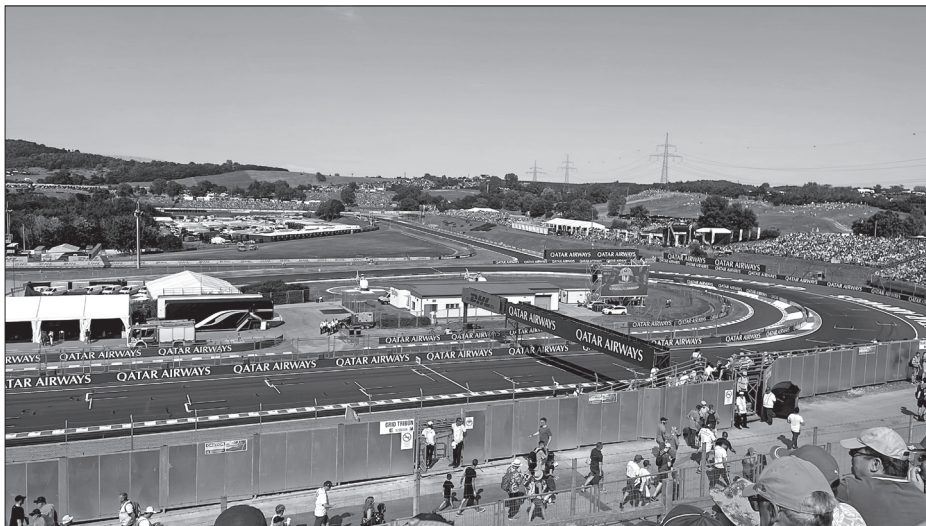
A mogyoródi pálya utolsó, 14-es kanyarja a 2023. július 29. és 31. között zajló Magyar Nagydíjon.

számára, mint hazája hírnevének öregbítése, az országimázs javítása?