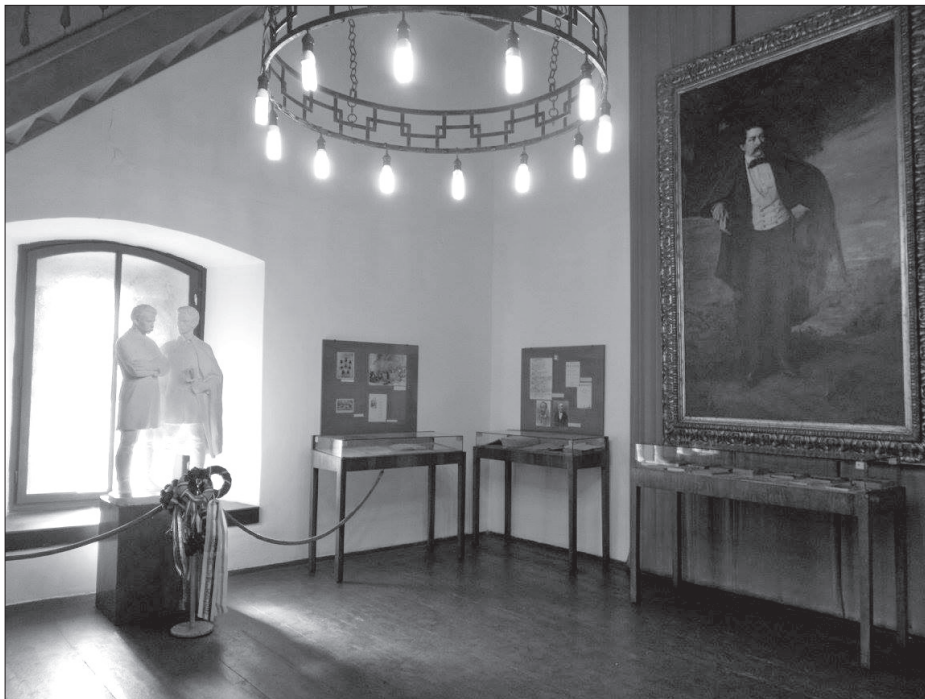
Az Arany János Emlékmúzeum 2018 óta felújítva várja a látogatókat.

csellel elfoglalta Budát, a Budáról menekült lakosok Váradig meg sem álltak, az ország háromfelé szakadt. Várad néhány év múlva az önálló Erdélyi Fejedelemséghez csatlakozott.