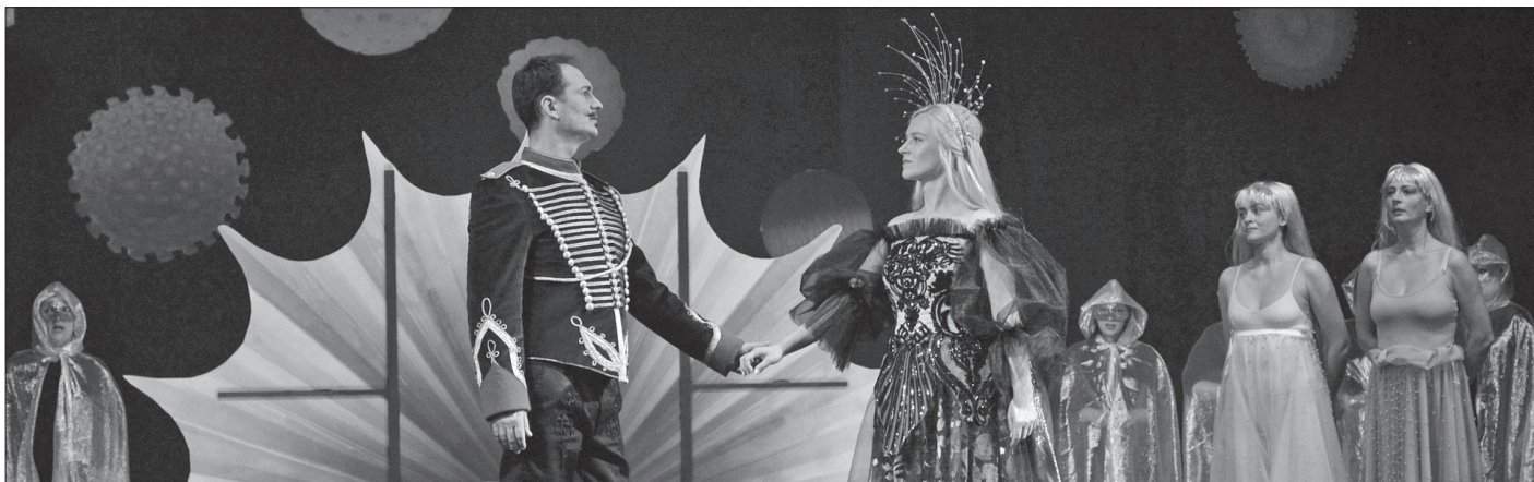
A János vitéz a Kolozsvári Magyar Opera színpadán, 2023-ban.

Volkman, R.: Szerenád op. 62. (C-dúr). Előadja a zenekar. Suppé, Fr.: Szép Galathea. Előadja a zenekar. 64 Az általam elérhető korabeli sajtóban a hangverseny krónikáját nem találtam.