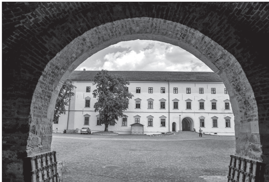
A nagyváradai vár részlete.

vajda történelmi szerepéről megoszlanak még a román vélemények is, az európai történelem zsoldosvezérnek tartotta. Veszélybe került az 1717 és 1734 között épült Szent László-templom is, 1964-ben a hatalom kiadta a parancsot: Lebontani! Ez már sok volt a váradiaknak, néma tüntetést szerveztek, felekezeti és nemzeti hovatarozás nélküli ellenállás mentette meg a templomot. Korábban volt egy fából készült honvédszobor is, 1917-ben avatták fel a városháza előtti téren az Isonzónál harcoló magyar katonák hősiességének állítottak emléket. 1919-ben a megszálló román hadsereg elsőnek bontotta le a katonaszobrot. Nem is bontották, hanem összetörték, és a Körösbe dobták a darabjait.