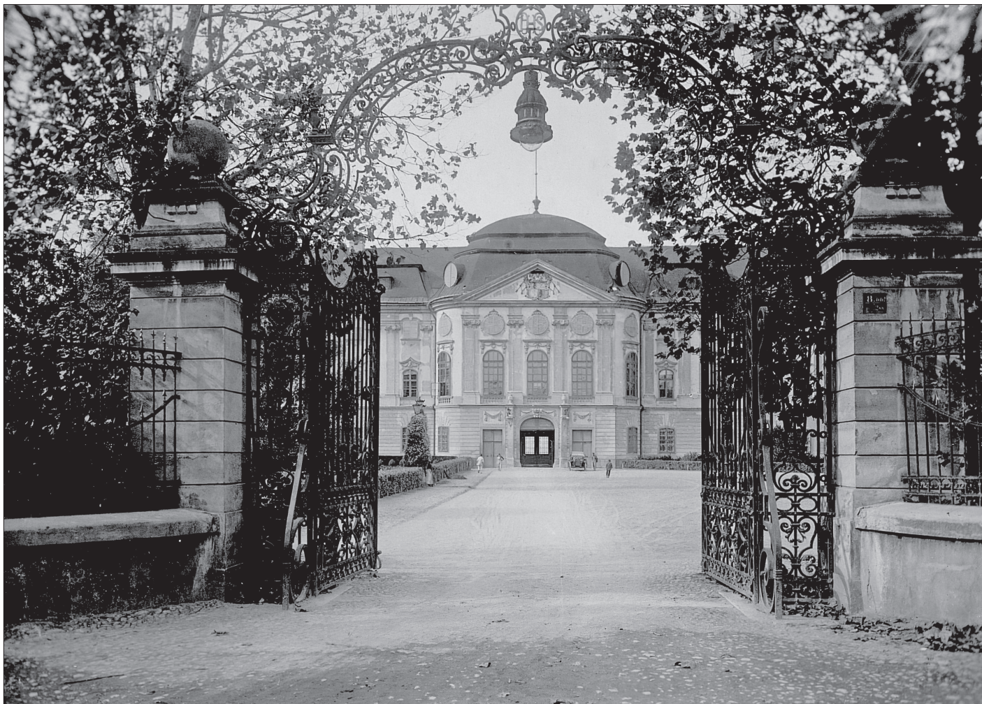
A nagyváradai római katolikus püspöki palota bejárata 1916-ban.

Ady Egy kis séta című írása (1901-ben a Nagyvárad Friss Újság ban jelent meg), a Kanonok sor bemutatása háromnapos büntetéssel járt a költő számára, ez a cikk hozta meg neki a várt sikert, elismertséget a publicisztikában és a magánéletben. A háromnapos fogság után még cikket írt A börtön filozófiája címmel is. Életművében, költészetében, képzeletvilágában új szín jelent meg, a szerelem, az asszony mítosza: megismerkedett Lédával. (Brüll Adél, 1872–1934, 1894-ben kötött házasságot Diósy Ödönnel.) A Léda-legendát Ady teremtette meg a verseivel, a Léda zsoldárával , A könnyek asszonyával , amelyeket majd követett a többi Léda-vers. Ady, bár már 1904-től nem élt Váradon, csak néha látogatott a régi városba, meghívásoknak eleget téve, Lédával együtt vállalva a világ előtt összetartozásukat. Első kötetének, a Vér és arany nak hatalmas sikere volt. (Aztán eltelt az idő, és megszületett az Elbocsátó szép üzenet is.) A költő részt vett a Holnap megszületésében is Váradon, Juhász Gyulával, Babits Mihállyal, Emőd Tamással, Balázs Bélával, Dutka Ákossal