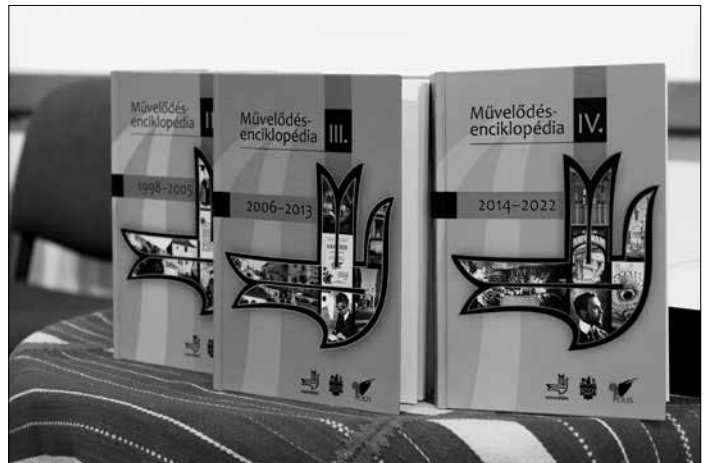
Demeter Zsuzsanna felvételei a Művelődés-díj átadó ünnepségen a kolozsvári Györkös Mátyás Emlékházban 2023. december 14-én