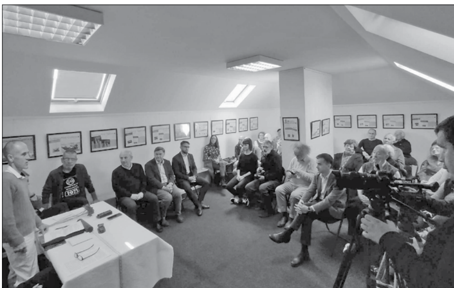
A Székelyföld-díjak átadó ünnepsége a szerkesztőség épületében található Székelyföld-galériában 2023. október 20-án

A tizenkét kötetes magyar történetimonda-katalógus a világon elsőként rendszerezte és összegezte egy nép történeti mondakincsét. A négykötetes erdélyi magyar hiedelemmonda-katalógus pedig a nemzetközi folklorisztika eddigi legnagyobb szabású olyan monográfiája, amely típus és motívumindex formájában, hatalmas