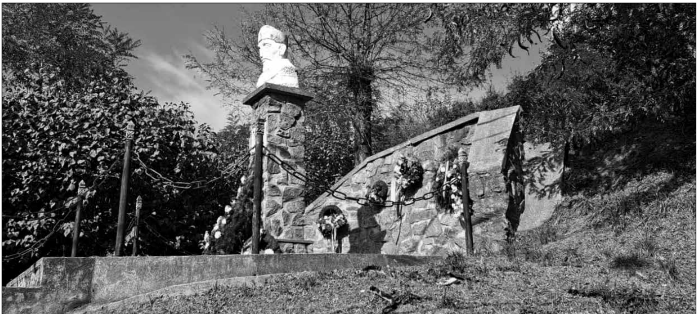
Báthory István erdélyi fejedelem és lengyel király mellszobra Szilágysomlyón. A Szilágysági Magyarok Díjat az ünnepi szentmisével és koszorúzással zárult XXXI. Báthory Napok többnapos rendezvénytöredékén adták át.

Szomorú, hogy elismerésünket már nem mondhatjuk el neki személyesen. Igen korai tragikus távozása megfoszt kedves jelenlététől, de emlékeinkben megmarad, mert aki életében értéket alkotott, aki nem csak önmagáért élt, az nem múlik el.