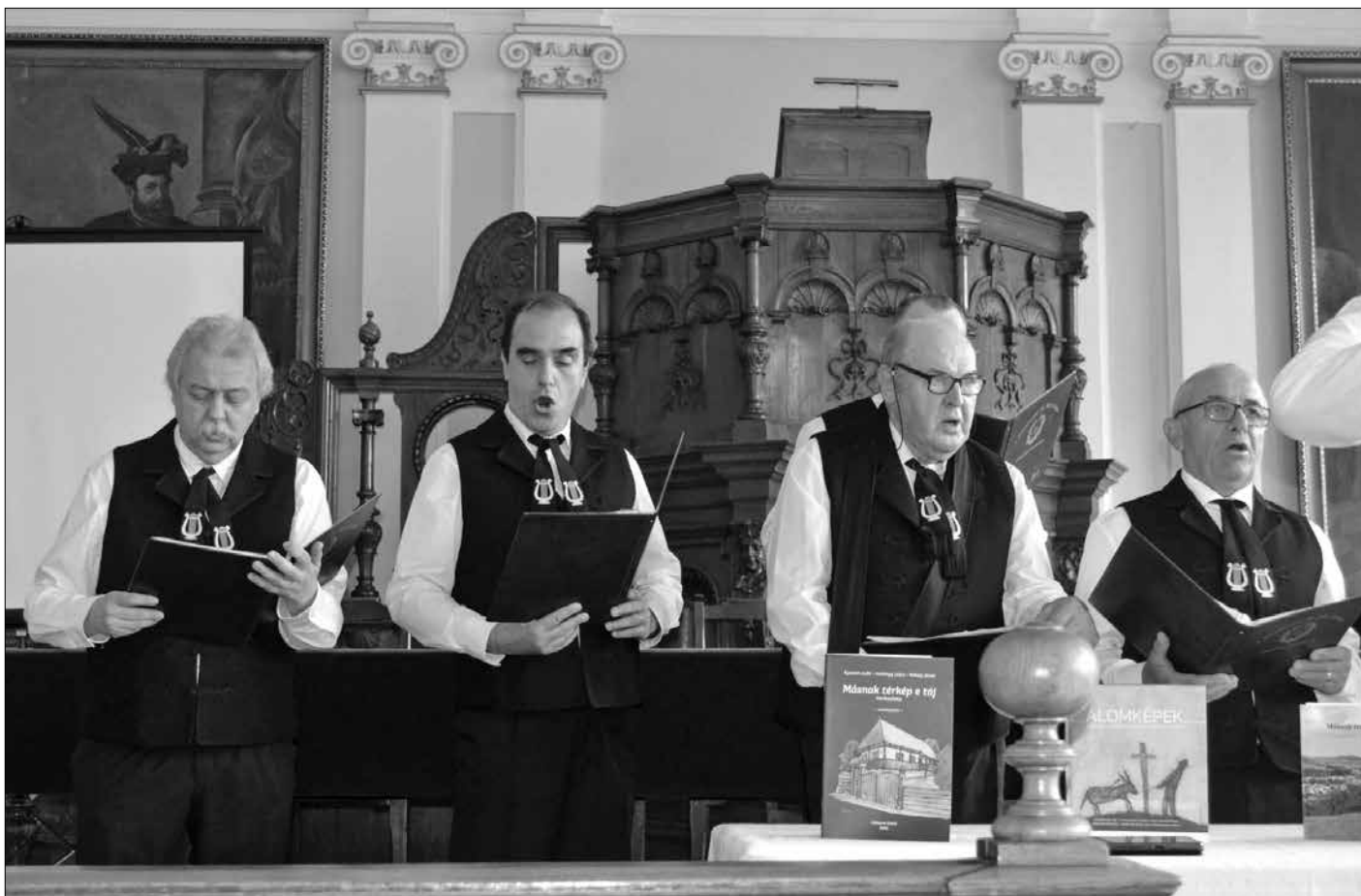
A Hídelvei Evangéliumi-Református Földész Énekkar előadása az EMKE-díjak átadó ünnepségén, 2023. április 15-én.