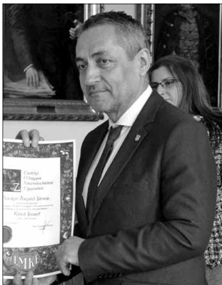
Potápi Árpád János

Potápi Árpádot – mint mondtam – szinte naponta látom. Én magam is, kollégáim is, az egész államtitkársági apparátus látja a hivatalt vezető államtitkárt, amint tervekkel készíti, költségvetést elemez. A mi feladatunk az, hogy segítsük őt a legjobb döntéseket meghozni. Az én feladatomban az, hogy az erdélyi, romániai magyar közösség pulzusát tapintva segítsem őt. Néha nem könnyű ez a feladat, mert ő is legalább annyira tud pulzust mérni. A mi közös munkánk legkirívóbb sajátossága az, hogy soha nem az iroda vagy a hivatal falai között, még csak nem is az ország határain belül látható ennek a munkának a tényleges eredménye, hanem Rimaszombaton, Királyhelmen, Beregszászon, Szabadkán, Topolyán – vagy Aradtól Szatmárig, Zilahról