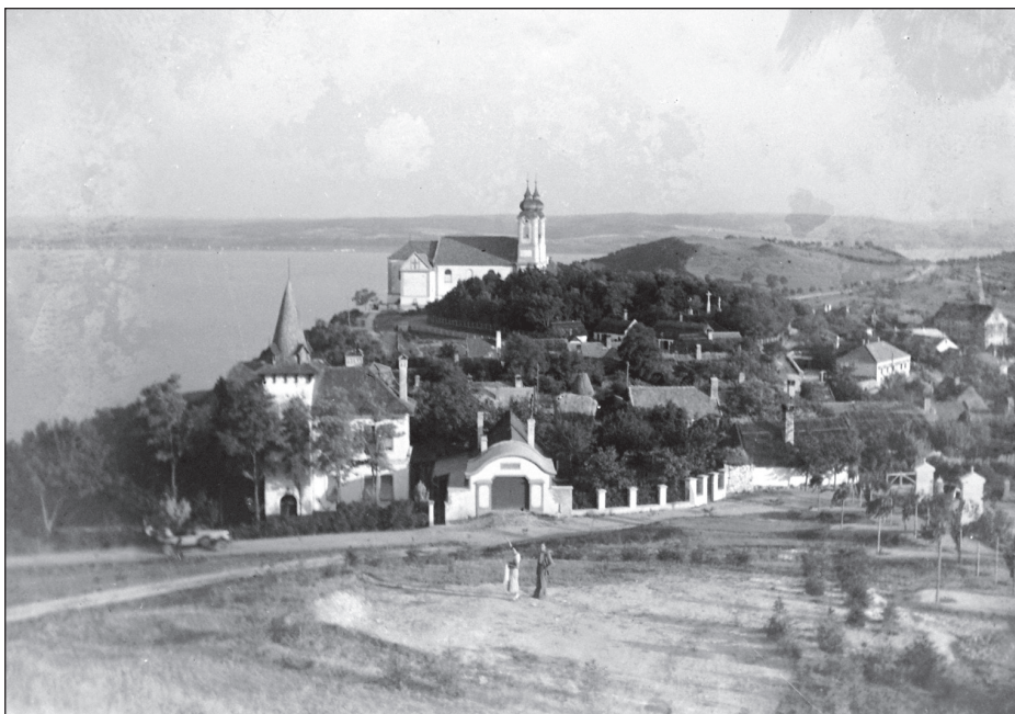
Tihany, előtérben az emeletes Hevesi villa (1930).

a nevét Hevesire. A veszprémi gimnázium elvégzése után a budapesti állatorvosi főiskolán szerzett diplomát. Működését Bábólnán, a magyar lótenyésztés fellelővárájának tartott, később a Bábólnai Ménes név alatt elhíresült katonai ménésbirtokon kezdte, ahonnan 42 évi szolgálat után 1919-ben vonult nyugalomba. Szolgálatának elismerésül a magyar királyi és császári főtörzsállatorvos 1913-ban megkapta a Ferenc József-rend lovagkeresztjét. Számos előkelő társadalmi és tudományos egyesületnek volt a tagja. 3