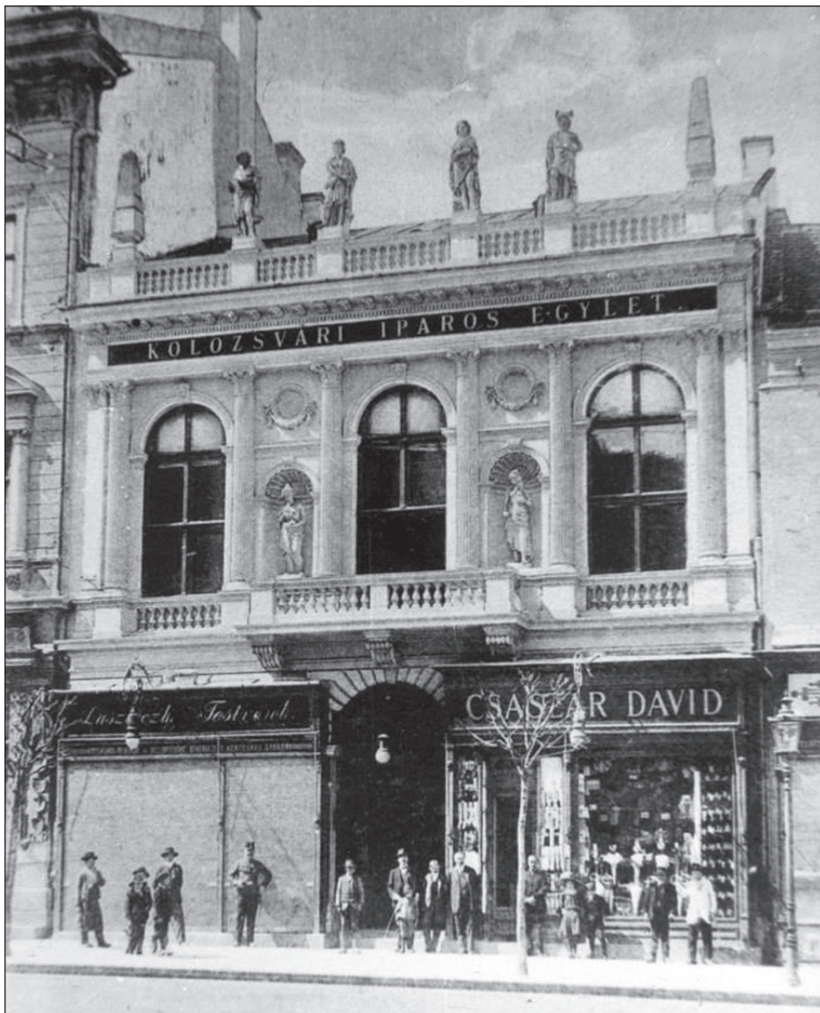
Az Iparos Egylet székháza az 1940-es években, a Főtér 24. szám alatt.