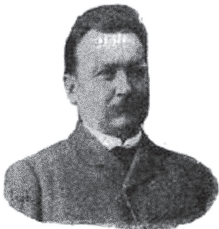
B. Bak Lajos portréja (1896).