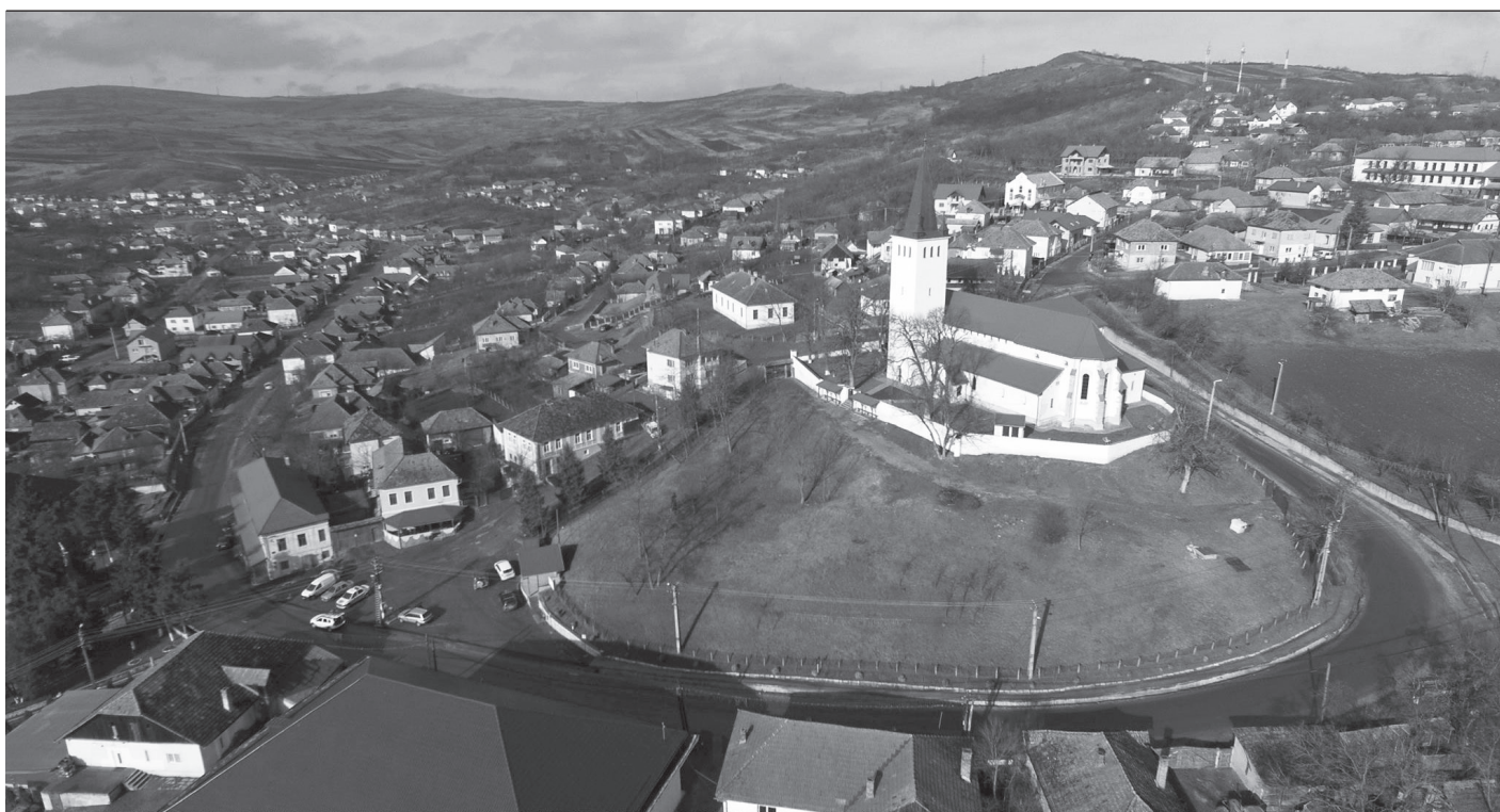
Szék látképe, a műemlék templommal. Veress László felvétele, 2016

a kutyánk megkergette a libáit –, mindig égre emelt ököllel átkozta a fajtánkat, és kutyafejű tatároknak nevezett bennünket, ami engem arra készítetett, hogy már egészen kis koromban arról faggassam szüleimet és főleg nagyszüleimet, hogy miben is gyökerezik ez az állítás? Ilyen formán már korán olyan információknak jutottam birtokába, amelyek annyira megmozgatták a fantáziámat, hogy aztán egész további életemben ennek a témának lettem a megszállottja. Amikor minden nyáron a zsúfolásig megtelt óriási református templomunkban, augusztus 24-én, Szent Bertalan napján az istentisztelet alkalmával a lekipásztor felolvasta a Memoriálét, és benne az ősök fogadalmát, libabőrösen távoztam a templomból, s egész nap valamilyen átszellemült hangulatban lebegtem a képzelet és valóság között. Hát hogyne, amikor arról