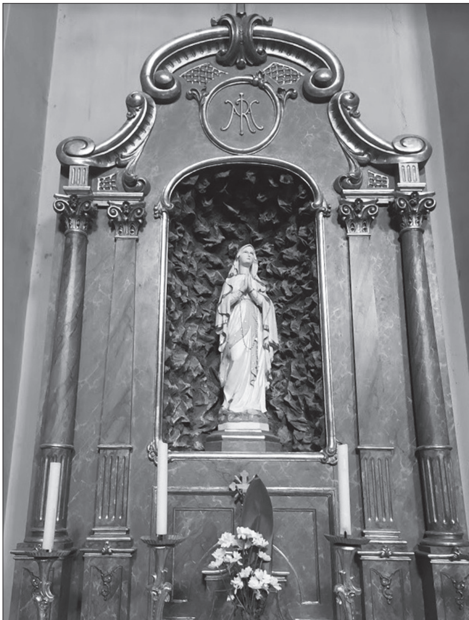
A tihanyi lourdes-i Mária-oltár.

ezt a valóban siralmasnak tetsző bevonulást, elgondoltuk, hát ez az a dicső román hadsereg? Ezekről ugyan nincs mit félnünk!”