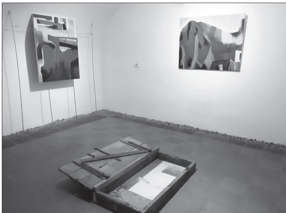
A tárlat részlete.

A kortárs erdélyi képzőművészek újabb munkáit hívatott e kis galéria bemutatni, az alkotószakma elkötelezett képviselőinek kíván kiállító felülete, közege lenni.