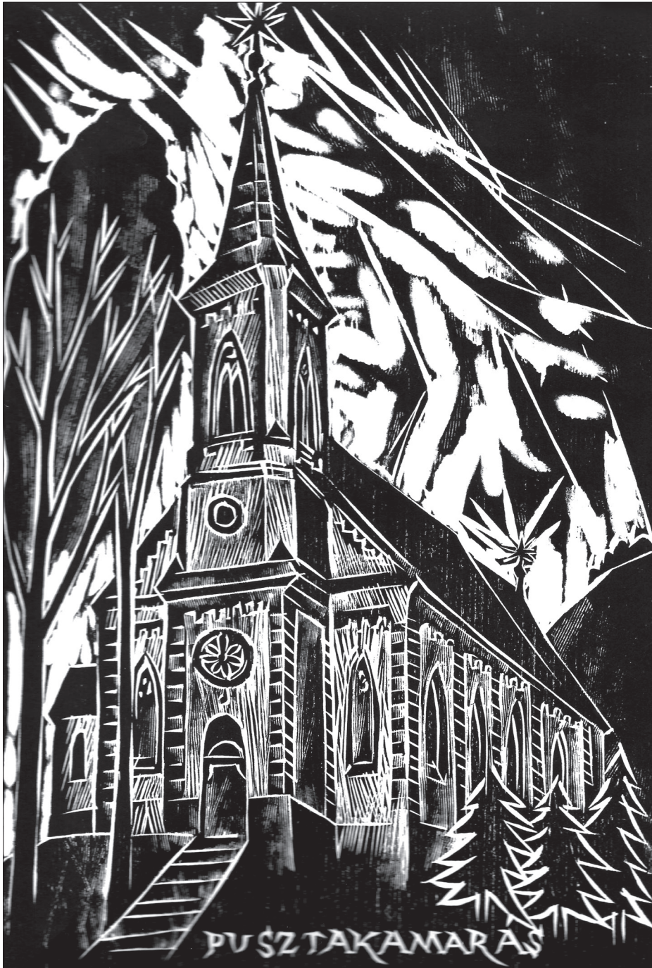
A pusztakamarási református templom. Molnár Dénes fametszete, 1997

annyira beszédes tény, hogy a 80. élet-éve felé járó Sütő Andrásnak gondja volt arra, Istók Sándor családkönyve ne csak megőrződjön és kutatható legyen, hanem folytatódjék az időben. Ezt a feladatot a közelében levő „pennás emberre”, Székely Ferencre bízta. Elődjéhez hasonló hangyaszorgalommal, nagy kitartással néhány év alatt feltérképezte és számítógépre vitte, egyházi nyilvántartás alapján az 1926 utáni 80 év pusztakamarási magyar családjait, összesen 226-ot. Így kerekedett ki az alcímbe 300 év 700 magyar családjá, Pusztakamarás családi térképe.