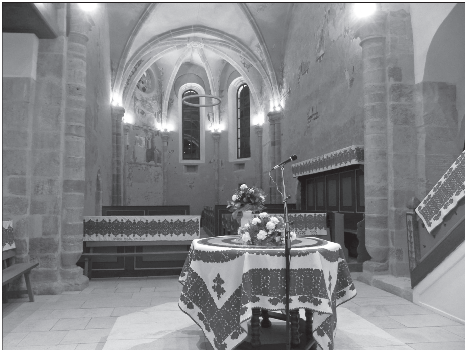
A széki templombelső, a vérengzés színhelye. Michel von Langeveld felvétele, 2016

viseletbe öltözve, a templomban ösz-szegyülve, a véráztatta köveken állva, egyházi és politikai vezetőinkkel együtt egész nap imádkozunk, és arra emlékezünk, hogy valamikor, egy kegyetlen világban, kegyetlen leckét kaptunk a sorstól.