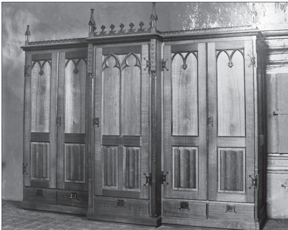
Kegyszerszekrény a Szent Mihály-templom sekrestyéjében.