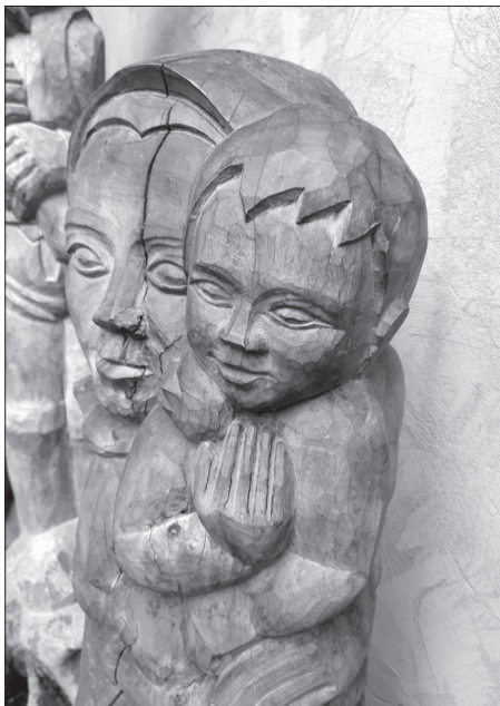
Jakab Zsigmond faragványa.