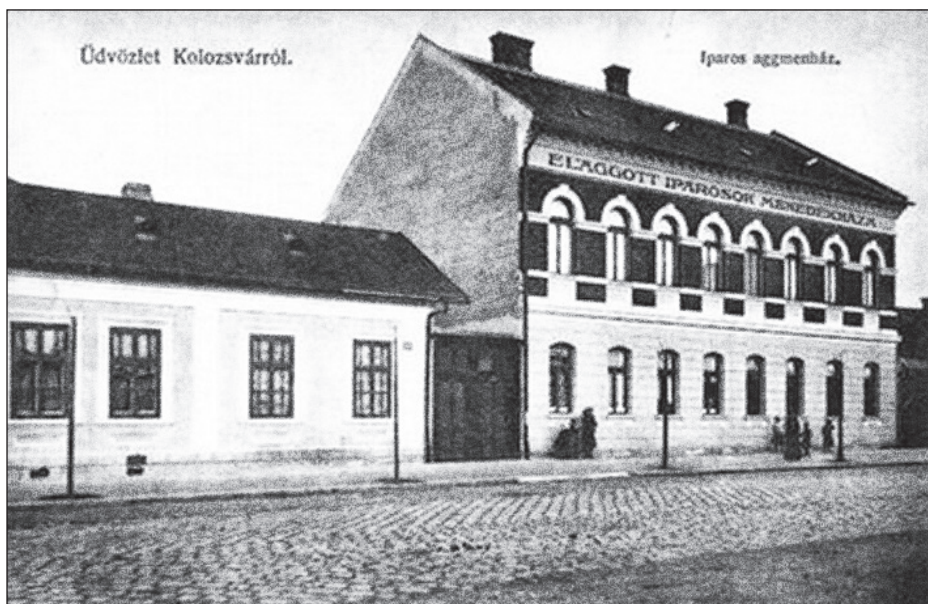
Az iparosok aggmenháza Kolozsváron.

menedékház” megvalósítása volt. A Reményik Károly által tervezett és a Rudolf út 22. szám alatt felépített emeletes aggmenházat 1905. március 19-én adták át ünnepélyes keretek között. Az eseményen az egylet tagjain kívül részt vett Kolozsvár város közönségének színe-java, Szvacsina Géza polgármesterrel az élen.